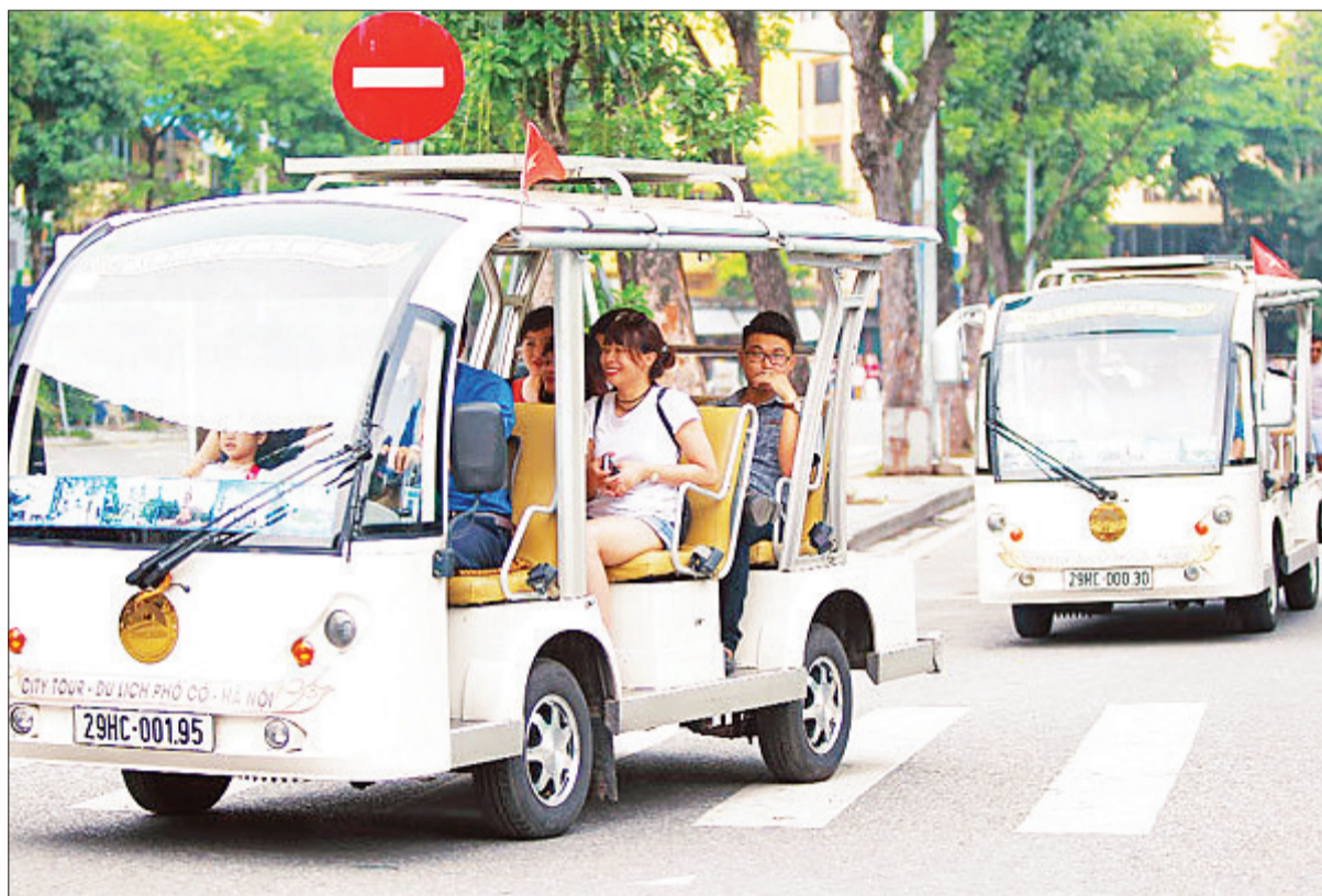
Xe điện phục vụ khách du lịch tại khu vực hồ Hoàn Kiếm.

Dù đã có những chuyển biến tích cực, nhưng việc kết nối giữa các loại hình vận tải hành khách công cộng ở Hà Nội còn nhiều hạn chế. Cùng với việc tập trung phát triển vận tải hành khách khối lớn, thành phố đang nghiên cứu đa dạng hóa các loại hình phương tiện, trong đó có xe điện bốn bánh.