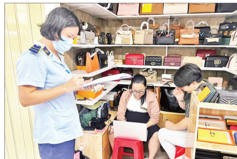
Lực lượng quản lý thị trường thành phố thương xuyên kiểm tra hàng hóa bày bán tại Saigon Square và liên tục phát hiện vi phạm.

Hàng giả, hàng nhái thương hiệu không chỉ được bày bán trực tiếp mà còn thi nhau lên mạng, sàn thương mại điện tử. Mới đây, Cục Quản lý thị trường thành phố đã liên tiếp truy bắt được bảo hộ tại Việt Nam. Đội Quản lý thị trường số 18 phát hiện hộ kinh doanh thời trang H.T.H. (đường Nguyễn Anh Thơ, xã Bà Điểm, huyện Hóc Môn) đang giới thiệu, chào bán hàng