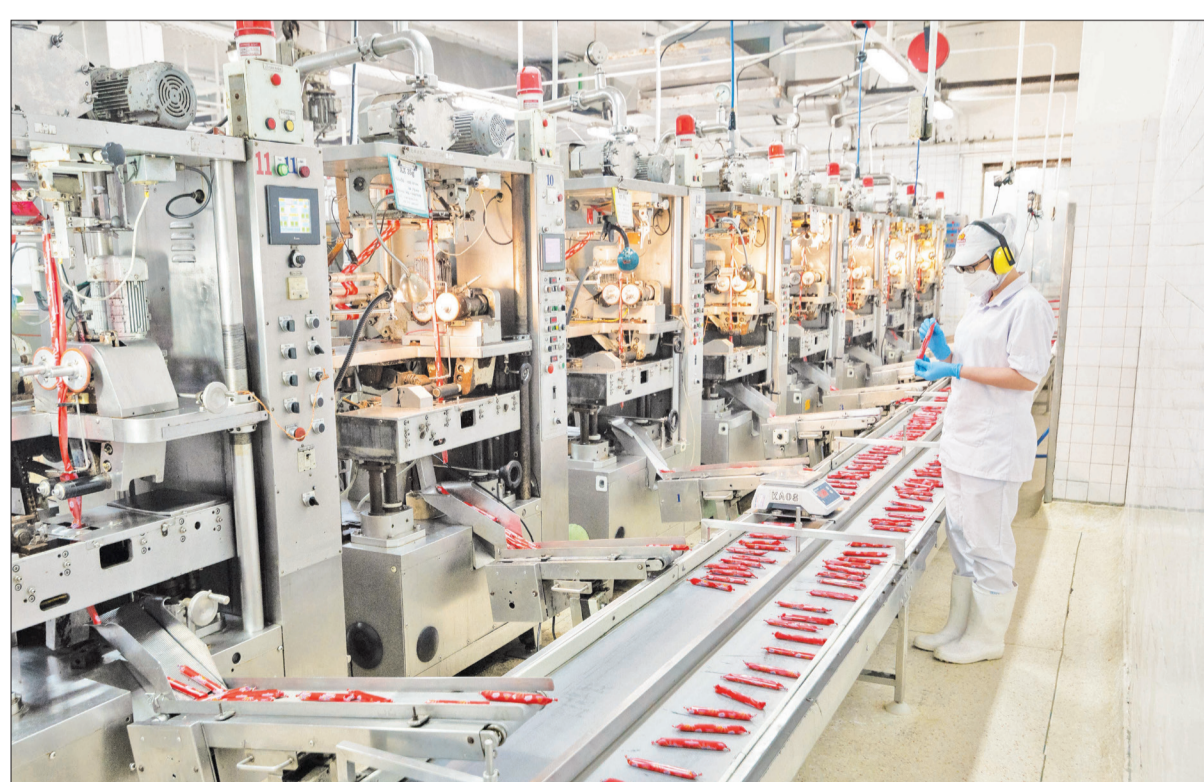
Dây chuyền sản xuất xúc xích tiết trĩnh của VISSAN.