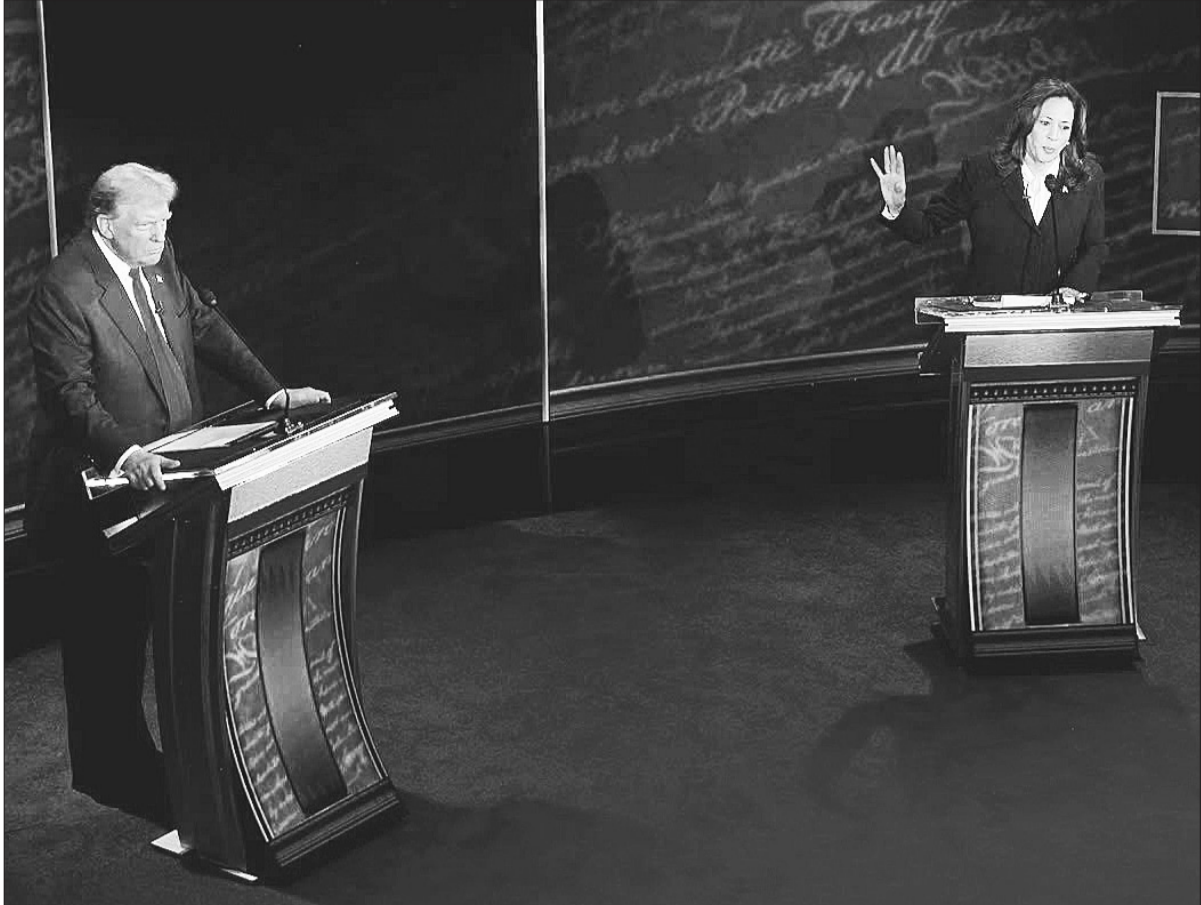
Bà Kamala Harris và ông Donald Trump tranh luận trực tiếp hôm 10/9/2024.

Ngày 5/11/2024, cử tri Mỹ đi bỏ phiếu trong cuộc tổng tuyển cử lần thứ 60 của xứ cờ hoa, trong đó quyết định quan trọng nhất là lựa chọn tổng thống, người lãnh đạo đất nước nhiệm kỳ 4 năm tới. Tâm điểm của mùa bầu cử năm nay, được đánh giá đầy kịch tính và khó đoán định là cuộc chạy đua giữa hai ứng cử viên với nhiều khác biệt trong cam kết tranh cử, gồm Phó Tổng thống Kamala Harris thuộc đảng Dân chủ và cựu Tổng thống Donald Trump thuộc đảng Cộng hòa.