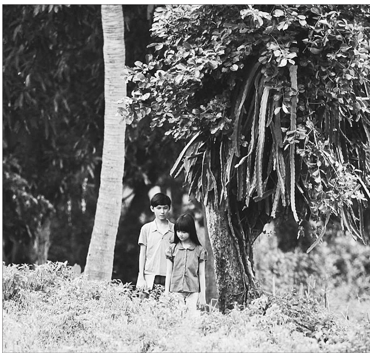
Một cảnh trong bộ phim "Tôi thấy hoa vàng trên cỏ xanh" - tác phẩm đầu tiên được Nhà nước (đặt hàng) và tư nhân hợp tác làm phim, đã tạo tiếng vang.

Chiến lược phát triển các ngành công nghiệp văn hóa Việt Nam đến năm 2020, tầm nhìn đến năm 2030 để ra nhiệm vụ quan trọng là xây dựng cơ chế ưu đãi, miễn, giảm thuế, phí phù hợp với thực tiễn và có tính khả thi nhằm thu hút đầu tư trong và ngoài nước vào lĩnh vực văn hóa nghệ thuật, phát triển các ngành công nghiệp văn hóa. Về pháp lý, lĩnh vực văn hóa được hưởng một số ưu đãi hiện hành, nằm trong các luật: Thuế thu nhập doanh nghiệp, Thuế xuất khẩu, Thuế nhập khẩu, Thuế giá trị gia tăng, Thuế sử dụng đất phi nông nghiệp, Nghị định số 144/2020/NĐ-CP về hoạt động nghệ thuật biểu diễn, Luật Điện ảnh 2022... Tuy nhiên, để có thể hòa ưu đãi của tài chính, thuế, đầu tư sang lĩnh vực văn hóa, thì chưa có khung pháp lý đặc thù. Vì vậy, khả năng tiếp cận các chính sách ưu đãi này của doanh nghiệp còn hạn chế