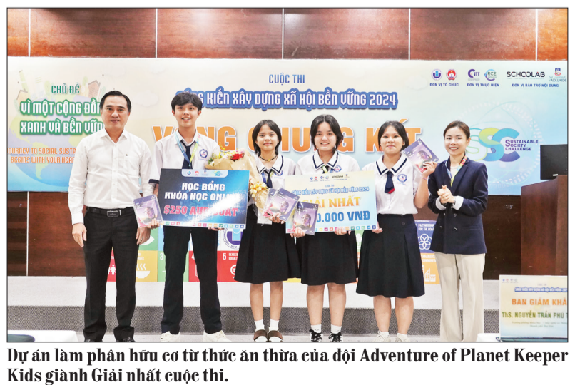
Dự án làm phân hữu cơ từ thức ăn thừa của đội Adventure of Planet Keeper Kids giành Giải nhất cuộc thi.