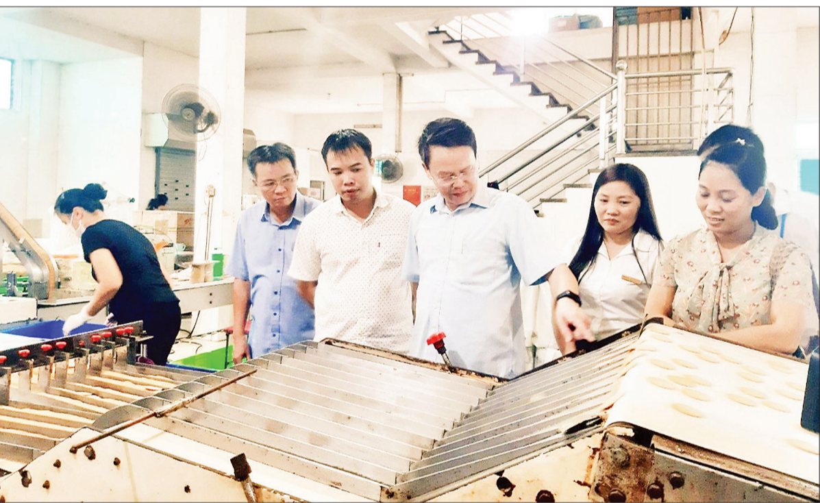
Thành viên Đoàn thẩm định nông thôn mới thành phố Hà Nội kiểm tra thực tế tiêu chí trong xây dựng nông thôn mới nâng cao tại xã La Phù, huyện Hoài Đức.