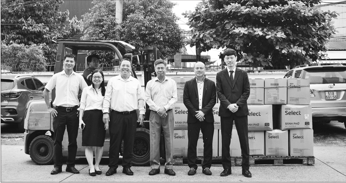
Lãnh đạo Saigon Co.op và đối tác Công ty STC Natural Vina bàn giao hàng hóa xuất khẩu sang thị trường Mỹ.

"Thông qua các hợp đồng thương mại giữa công ty với các đối tác, trong đó có STC Natural Vina, hàng Việt Nam sẽ có thêm nhiều cơ hội để