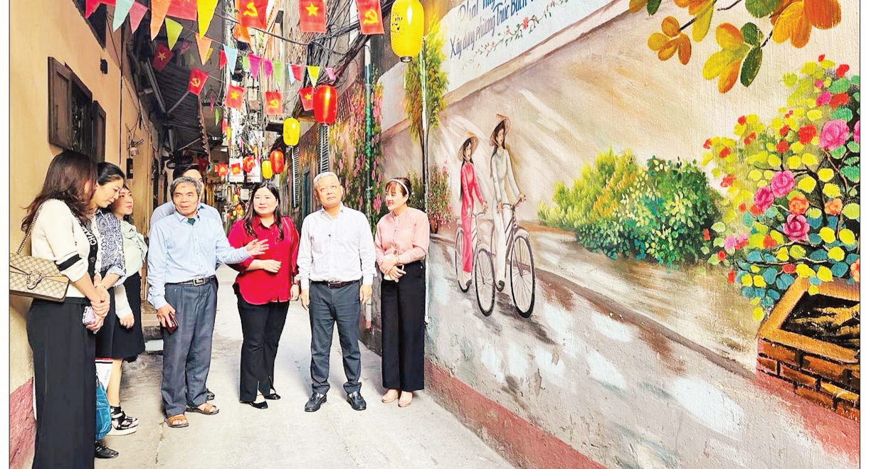
Ngõ 29 phố Cửa Bắc (phường Quan Thánh, quận Ba Đình) trở nên gọn gàng, sạch đẹp hơn nhờ việc tham gia cuộc thi.

Hiện nay, Sở Văn hóa và Thể thao Hà Nội đang khảo sát, chấm điểm cuộc thi tại các quận, huyện, thị xã. Nhiều quận có những chuyển biến tích cực, ngay cả những quận có mật độ dân số cao như: Hoàn Kiếm, Hai Bà Trưng, Đống Đa, Thanh Xuân... Điều đó góp phần giúp các ngõ, phố của Hà Nội ngày một xanh, sạch hơn từ ý thức người dân.