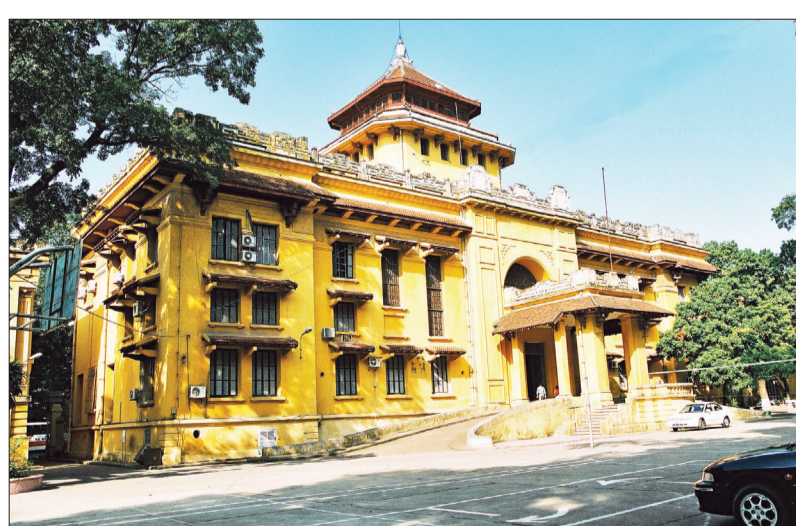
Đại học Quốc gia Hà Nội mang vẻ đẹp Á - Âu điển hình của kiến trúc Đông Dương.

Không nổi bật như Nhà hát Lớn, nhưng toà nhà chính của Đại học Quốc gia Hà Nội (trước kia là Đại học Đông Dương và tiếp đó là Đại học Tổng hợp Hà Nội) tại 19 phố Lê Thánh Tông (quận Hoàn Kiếm, Hà Nội) lại là kiến trúc độc đáo - kiến trúc đầu tiên có sự giao thoa văn hóa Đông và Tây. Giữa tháng 11 này, công trình mới của đơn vị đang diễn ra nhiều hoạt động nghệ thuật.