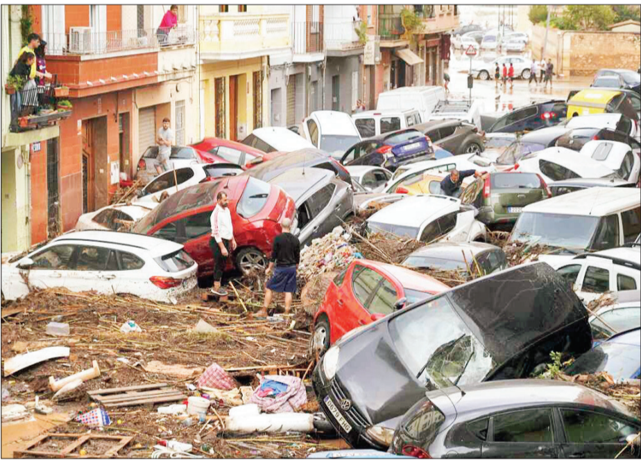
Ô-tô bị cuốn trôi trong trận lũ quét ở thành phố Valencia.

Tây Ban Nha thông báo để quốc tang ba ngày để tưởng niệm hàng chục nạn nhân chết trong trận lũ quét nghiêm trọng nhất 30 năm qua. Theo số liệu thống kê mới nhất, có ít nhất 95 người chết trong trận lũ quét, xảy ra hôm 29/10 ở thành phố Valencia, miền đông Tây Ban Nha. Số nạn nhân có thể còn tăng do nhiều khu vực chưa báo cáo thiệt hại, trong khi vẫn còn hàng chục người mất tích.