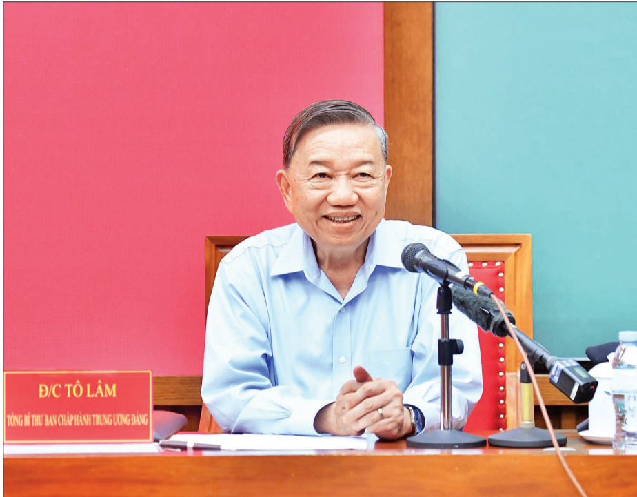
Tổng Bí thư Tô Lâm trao đổi chuyên đề về kỷ nguyên mới, kỷ nguyên vươn mình của dân tộc.