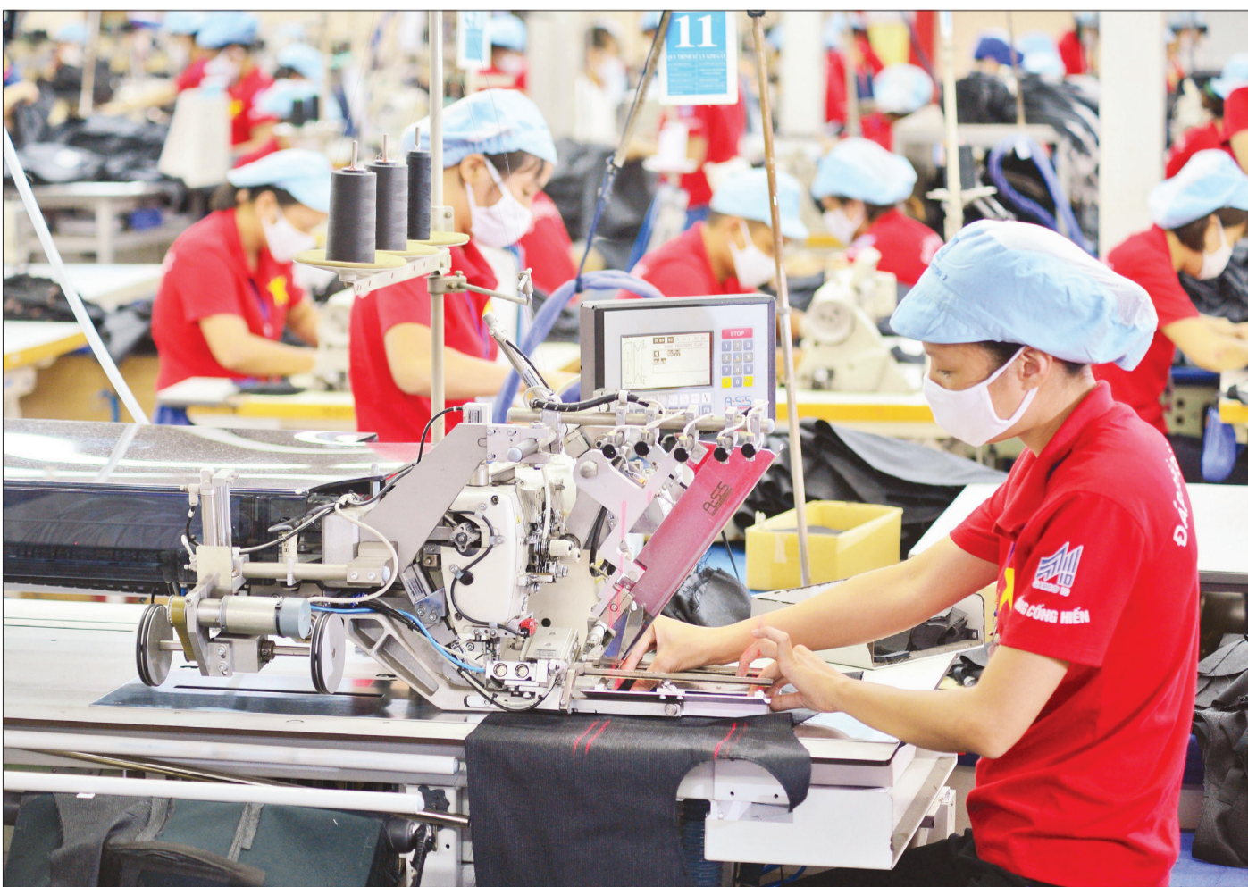
Sản xuất hàng dệt may xuất khẩu tại Tổng công ty May 10.