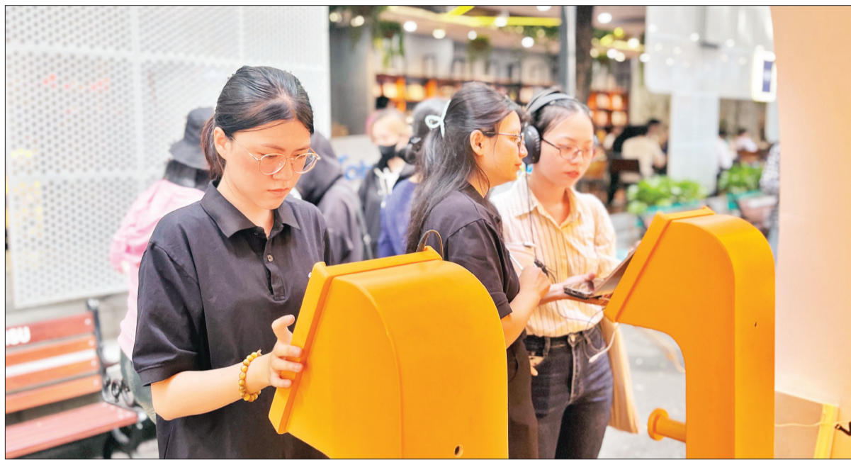
Độc giả trải nghiệm sách điện tử, sách nói tại Tuần lễ Sách và Chuyển đổi số năm 2024.

Trong năm 2024, Sở Thông tin và Truyền thông đã phối hợp với Hội Xuất bản Việt Nam (Văn phòng đại diện phía nam) và Hội in Thành phố Hồ Chí Minh tổ chức các tọa đàm "Chuyển đổi số - Cơ hội, thách thức của hoạt động xuất bản hiện nay", hội thảo "Khung năng lực số ngành in" gắn với chuyển đổi số trong lĩnh vực xuất bản, in và phát hành với sự tham dự, chia sẻ từ các chuyên gia đầu ngành. Đáng chú ý, tại Tuần lễ Sách và Chuyển đổi số mới đây, độc giả thành phố có cái nhìn toàn diện hơn về chuyển đổi số trong lĩnh vực xuất bản. Với 24 đơn vị tham gia, hơn 30 chương trình, hoạt động giao lưu, điểm nhấn của tuần lễ năm nay là độc giả sẽ được trải nghiệm hơn 3.000 tựa sách điện tử, sách nói cũng như những hình thức tiếp cận sách mới, trải nghiệm công nghệ về sách gắn với chuyển đổi số cũng sẽ mang đến cách nhìn sâu sắc hơn về chuyển đổi số trong xuất bản, thúc đẩy đưa công nghệ vào trong hoạt động này. Theo