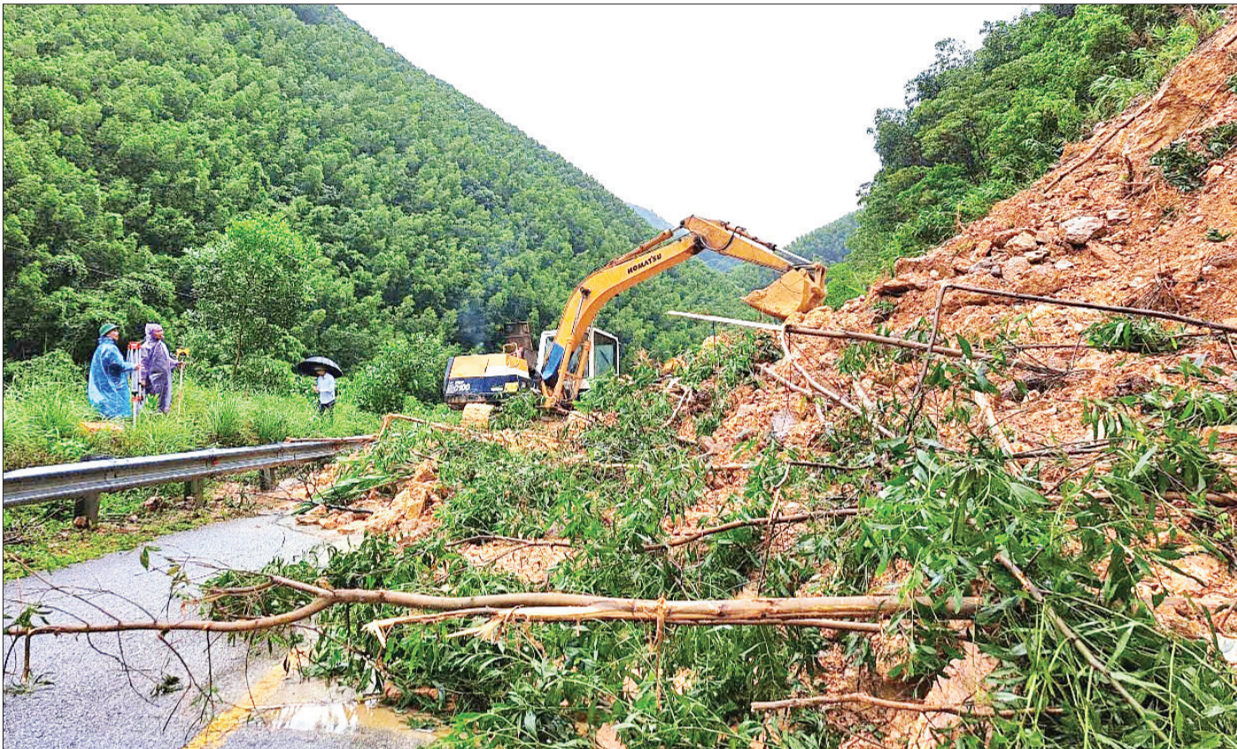
Đơn vị thi công xử lý sạt lở để thông tuyến Quốc lộ 9C đoạn qua huyện Lệ Thủy, tỉnh Quảng Bình.