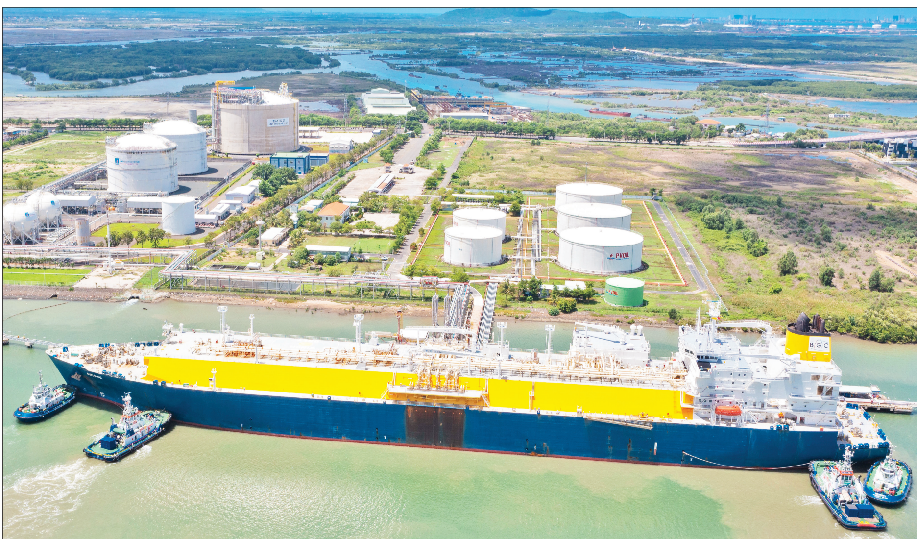
Tàu vận chuyển khí tự nhiên hóa lỏng (LNG) cập vào cảng Cái Mép (Bà Rịa-Vũng Tàu).