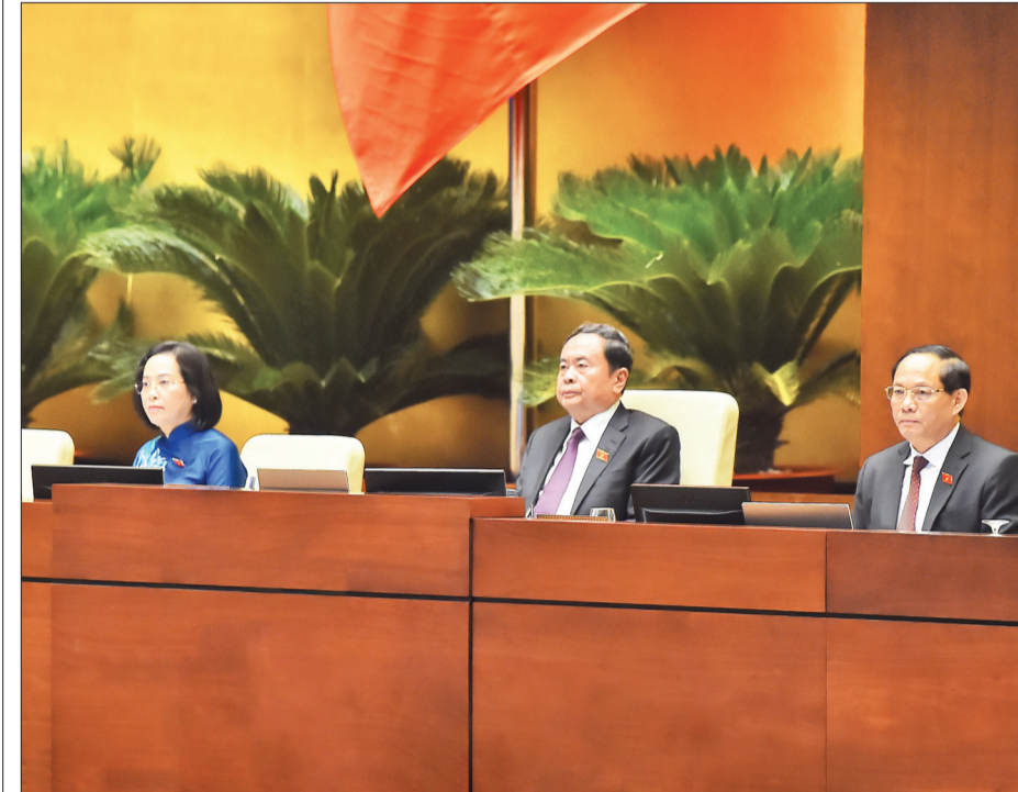
Chủ tịch Quốc hội Trần Thanh Mẫn và các Phó Chủ tịch Quốc hội dự phiên họp chiều 31/10.