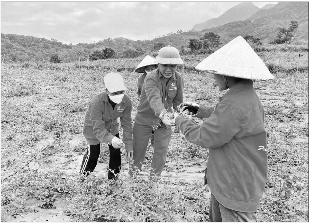
Người dân thôn Nà Sám, xã Thượng Giáo, huyện Ba Bể kiểm tra chất lượng cây cà gai leo.

sinh hoạt cộng đồng thôn; 57 công trình quy mô nhỏ khác.