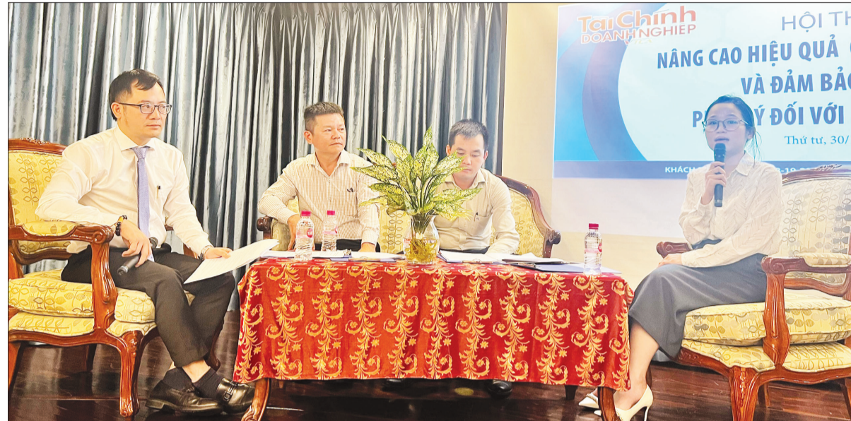
Các đại diện doanh nghiệp, chuyên gia trao đổi ý kiến tại hội thảo.

khoảng 39-45%. Tuy nhiên, một trong những vấn đề liên quan đến công tác quản trị và pháp lý, dù rất quan trọng nhưng chưa được nhiều doanh nghiệp, nhất là doanh nghiệp vừa và nhỏ chú trọng. Tại hội thảo “Nâng cao hiệu quả quản trị tài chính và bảo đảm an toàn pháp lý đối với doanh nghiệp” do Tạp chí Tài chính doanh nghiệp và Trung